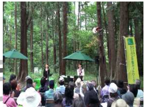
▲昨年の“森の音楽会”