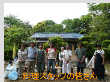
料理スタッフの皆さん