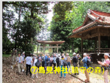
⑦鳥見神社(鎮守の森)